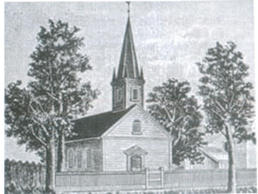
Deutsche Evangelische Gemeinde von Carrollton, 1849 (auch „The Rooster Church“ genannt)

Evangelische-Unionierte St. Matthäus-Kirche